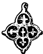
7.22. Латгальский (латышский) вариант двенадцатиконечного креста