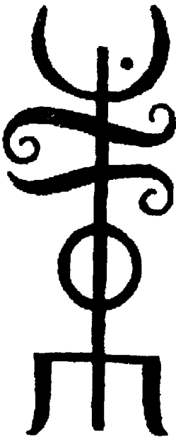
7.9. Техкур, вязаная руна Одина, изображенная на полях рукописи Эдды

Руна повторяет форму специального орудия — «волчьего крюка», с помощью которого в древности ловили волков. Предполагается, что руна могла передавать звук ai. Магическое назначение — охрана, пле-