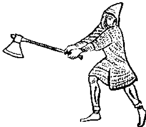
Рис. 80. Рыцарь, сражающийся датским топором

В рукописи, составленной в монастыре (в оригинале слово Vingy , в словарях оно отсутствует, хотя корень, естественно, тот же, что в Canterbury ) Святого Эдмунда в период между 1121 и 1148 годами, есть изображение воина, сражающегося топором (рис. 80). Возможно, это изображение самого короля Стефана.